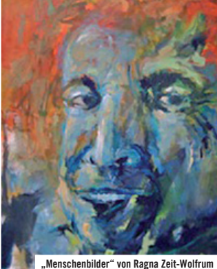
„Menschenbilder“ von Ragna Zeit-Wolfrum