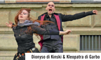
Dioniso di Kinski & Kleopatra di Garbo