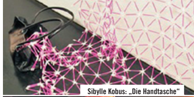
Sibylle Kobus: „Die Handtasche“