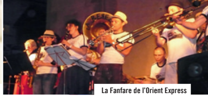
La Fanfare de l'Orient Express