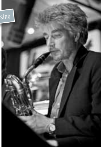
Wolfgang Roth.