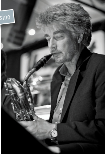
Wolfgang Roth.