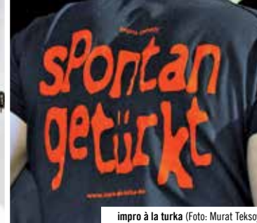
impro à la turka