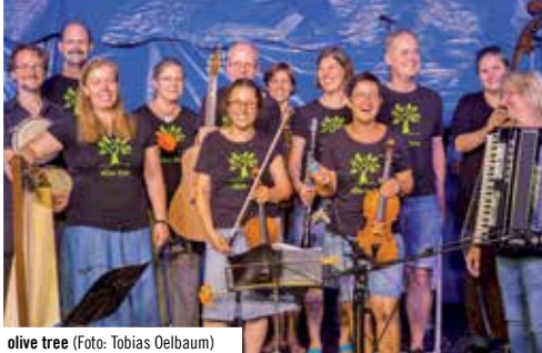
olive tree