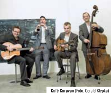
Café Caravan