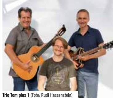
Trio Tom plus 1